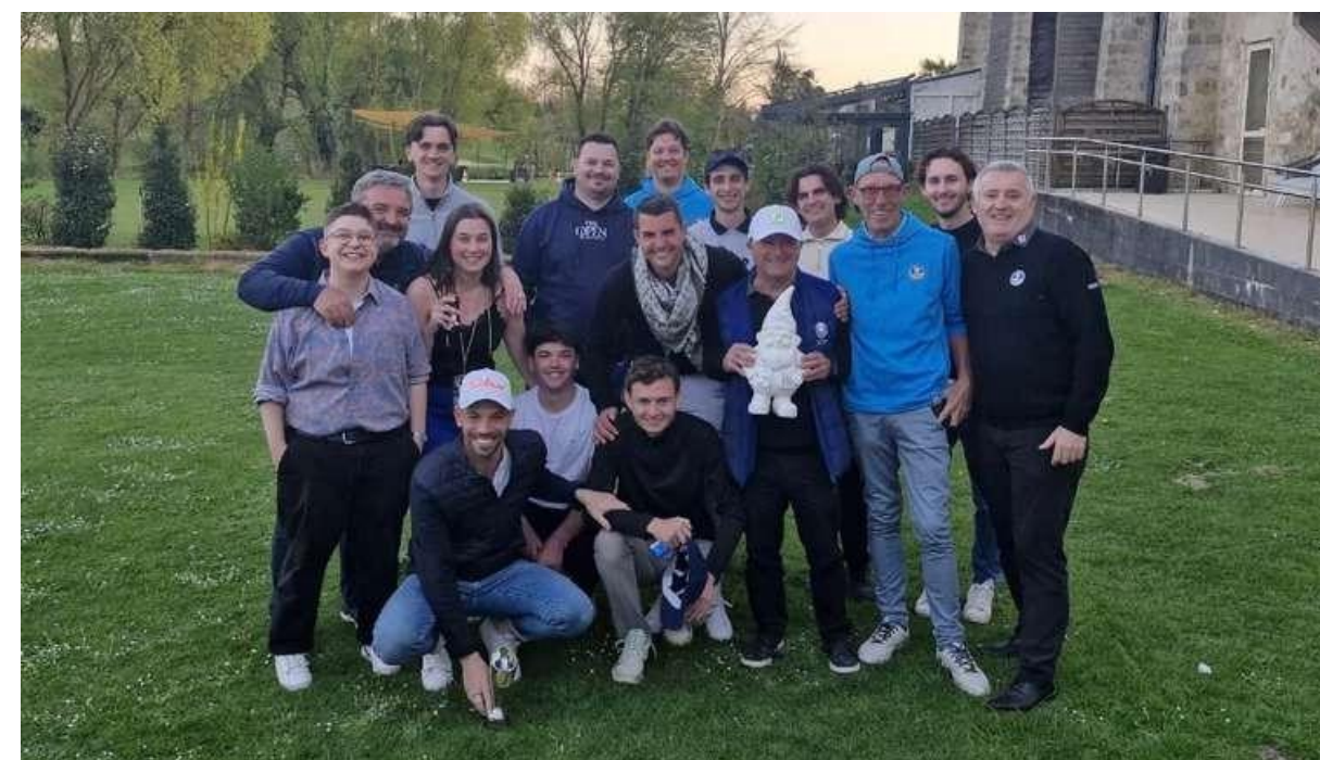
Promotion 2024-2025, AIMG CUP #37 Golf d'Ozoir la Ferrière

“Une formation unique et immersive pour bâtir une carrière solide dans le management du golf “