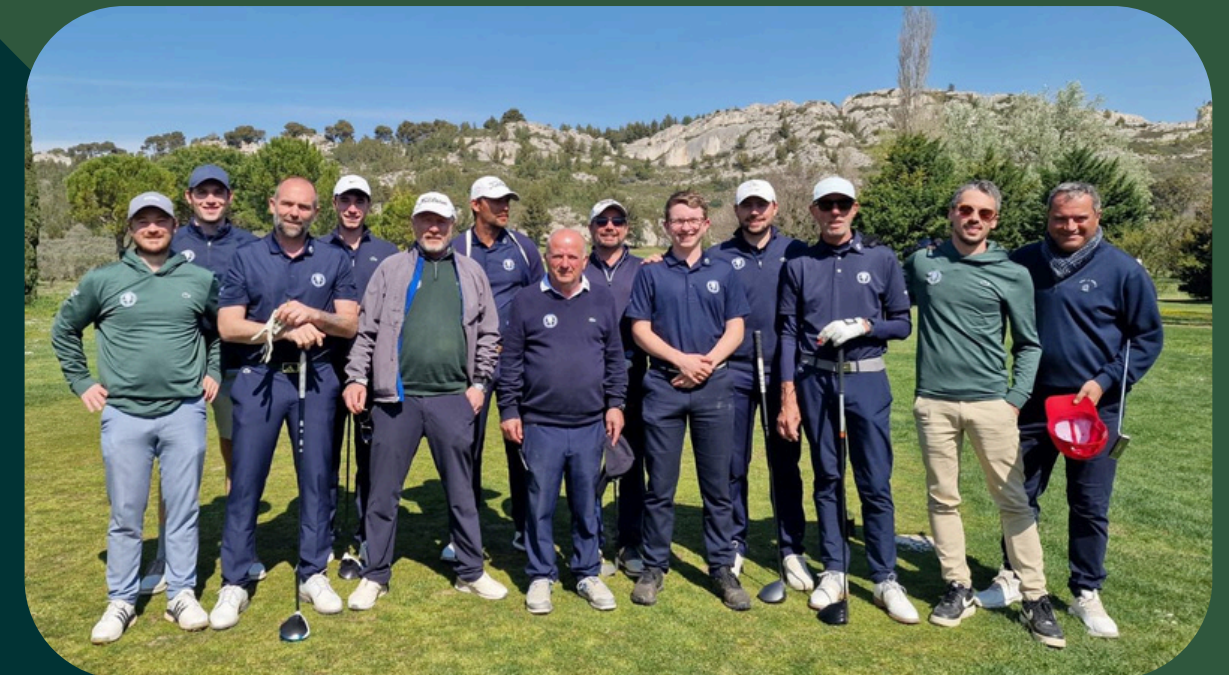
Promotion 2025-2026 #38

“Une formation unique et immersive pour bâtir une carrière solide dans le management du golf”